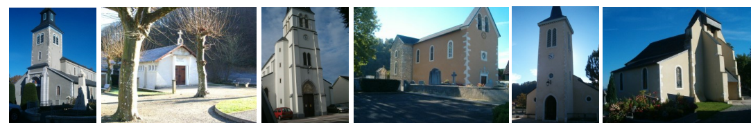
St Michel - ND de la Vallée Heureuse Gelos