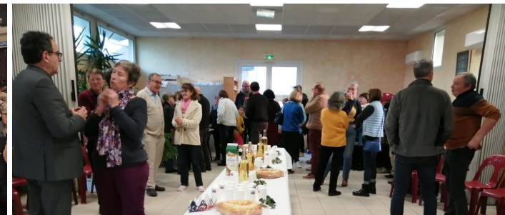
Veillée de Noël et partage de la galette