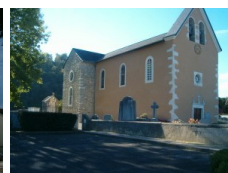
St Pierre Rontignon