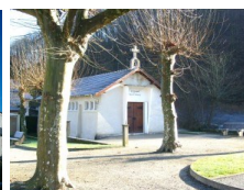
St Barthélémy Mazères