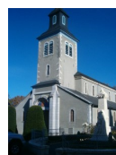
St Michel - ND de la Vallée Heureuse Gelos