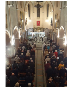
Rameaux - Jeudi Saint - Vendredi St - Vigile Pascale