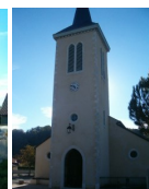
St Ambroise Narcastet