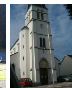
St Jacques Uzos