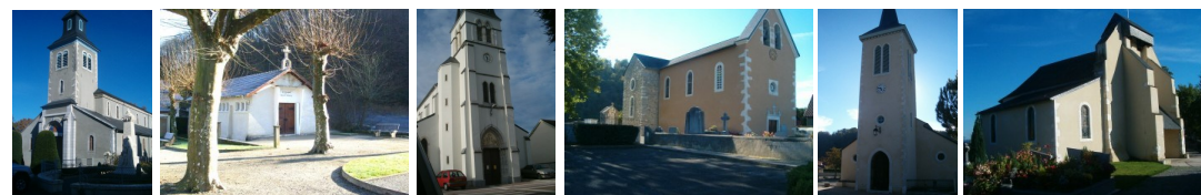
St Michel - ND de la Vallée Heureuse Gelos